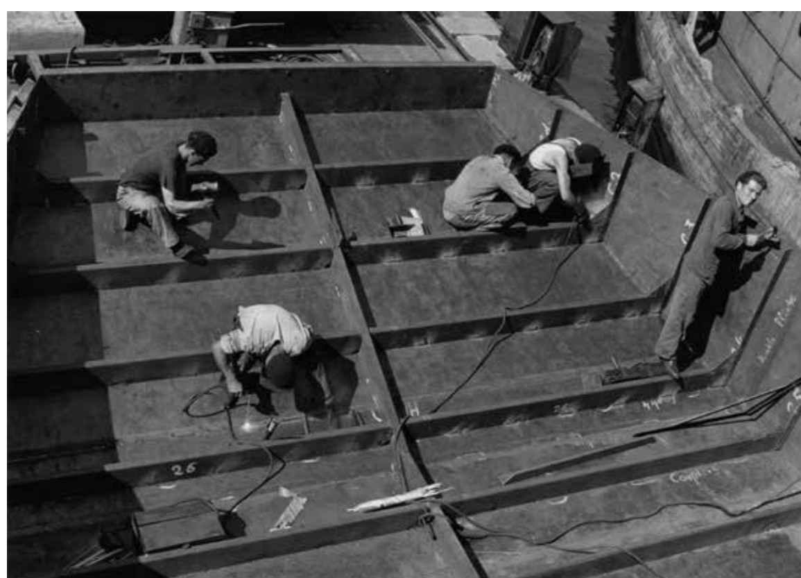
Construction sur rampe de lancement, dans les années 1950.

“ En apprentissage de traçage, c'était assez plaisant parce qu'on avait une certaine liberté, par exemple on montait le matin à vélo sur La Pallice pour embaucher à 7h30, on redescendait à 10h30 jusqu'à midi, on restait l'après-midi à l'école d'apprentissage, le lendemain on revenait au chantier, c'était diversifié ! ”