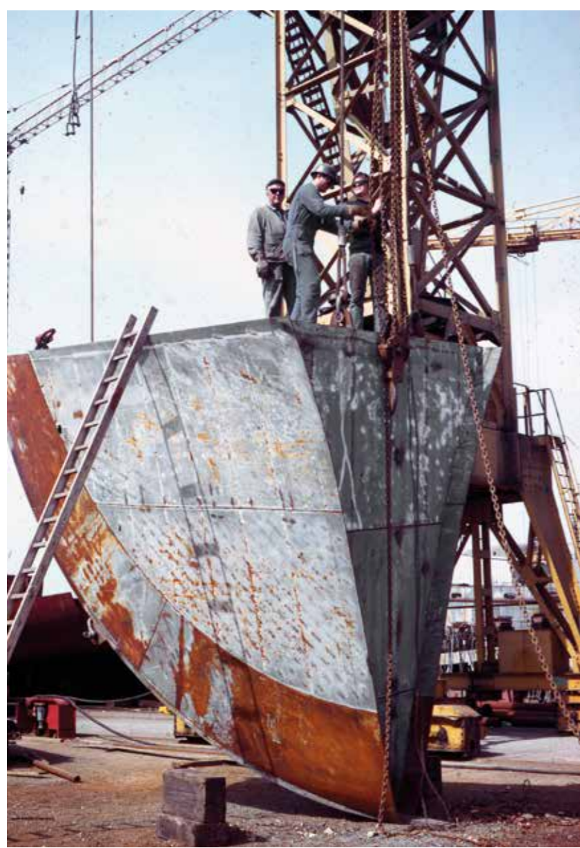
Bloc prêt à être assemblé sur cale de lancement.

“Ça, c'est des bruits de coursives, comme on dit.”