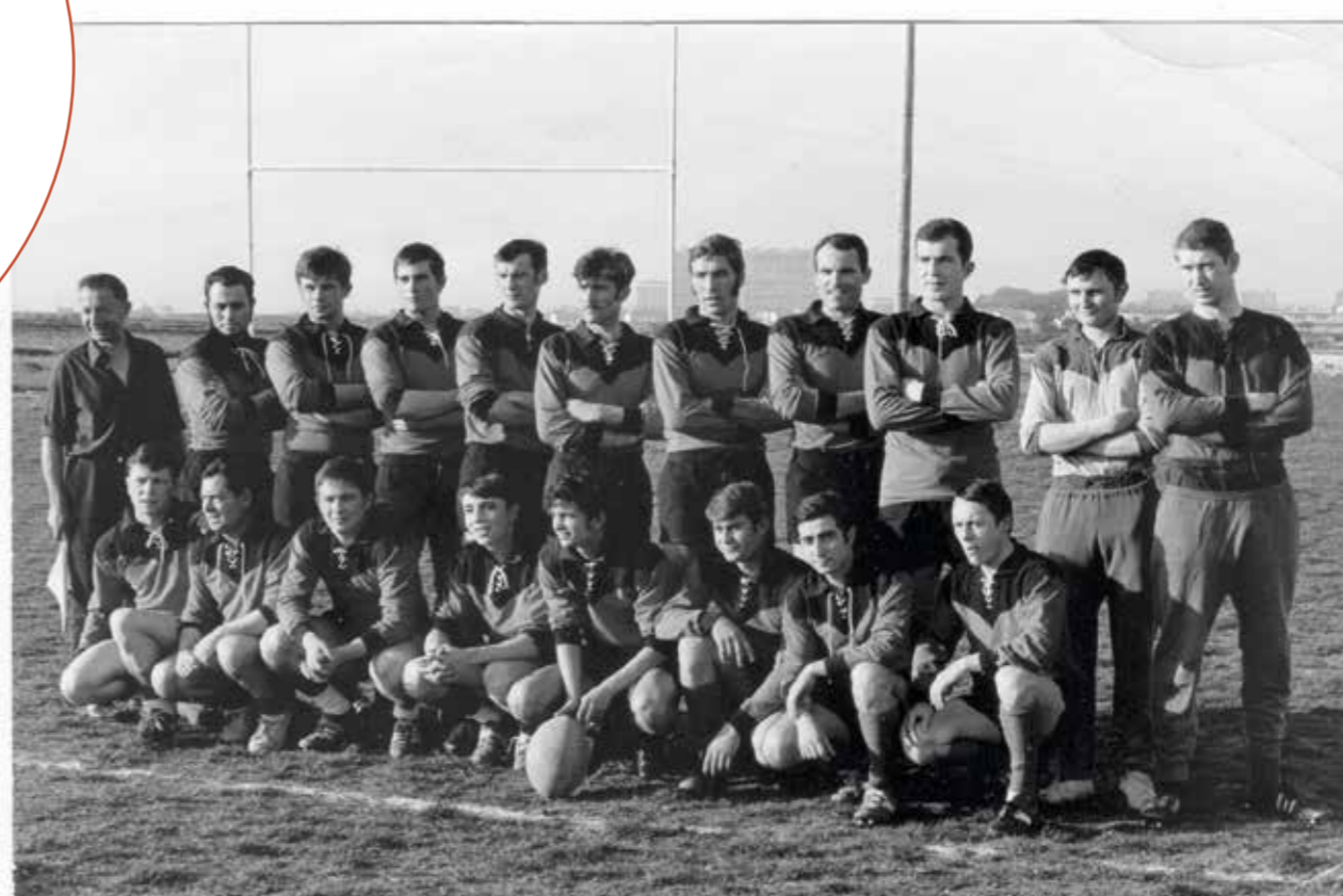
L'équipe de rugby des ACRP, en 1969.

“En colonie, les parents venaient nous voir à vélo, en tandem, ou en vachère pour la fête.”