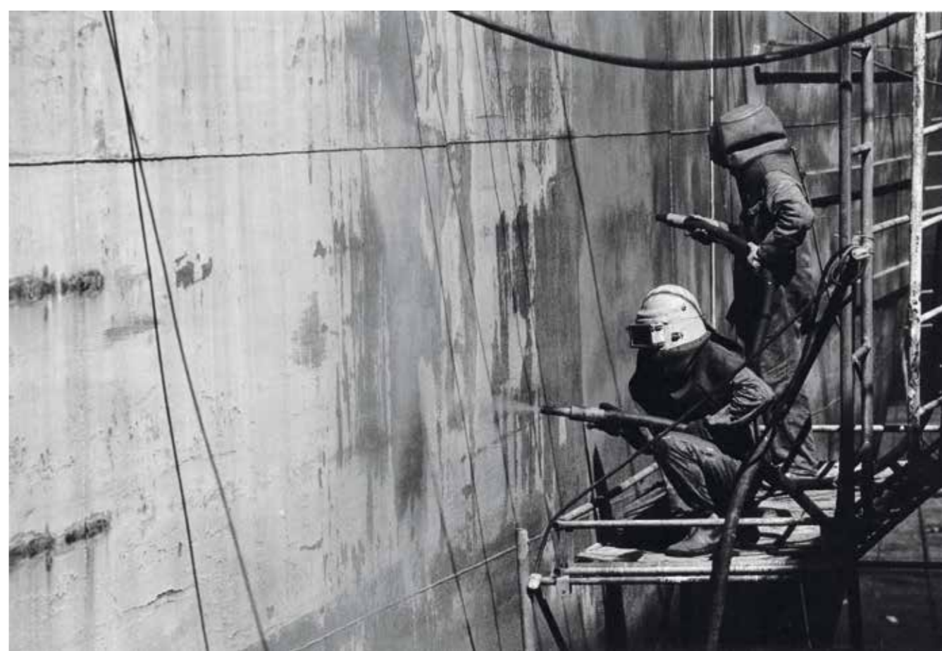
Sableurs de coque en 1986.

“ On bouffait de l'amiante, tout le temps ! On ne travaillait que des aciers spéciaux, donc pour les souder, il fallait préchauffer à une température de 150 à 180 degrés et, pour ne pas que ça refroidisse trop vite, on bâchait avec des toiles d'amiante. ”