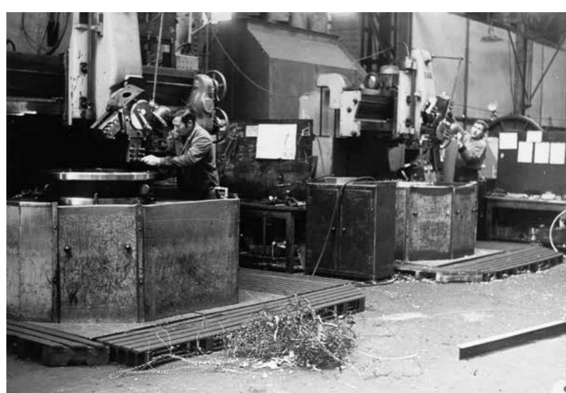
Tourneur dans l'atelier de mécanique, en 1967.