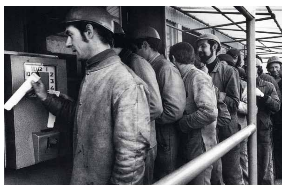
Le pointage à l'embauche, en 1970.

“Pour un départ en retraite, la collecte se faisait souvent dans tout le chantier.”