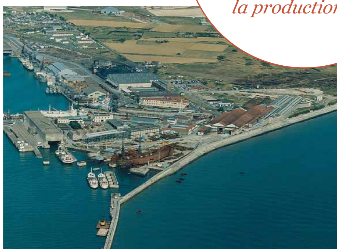
Vue aérienne des Chantiers, vers 1960.

“ Aux Chantiers, il y avait des filles au service administratif mais je n'en ai jamais connu dans la production. ”