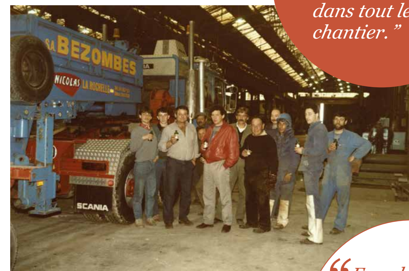
Le personnel coque après la mise à l'eau de l'Alcyone du commandant Cousteau.

Un comité d'entreprise très actif organise les arbres de Noël, accorde des primes pour les mariages et les naissances, offre des facilités pour des locations de vacances. Jusqu'en 1980, des colonies de vacances sont organisées pour les enfants de 6 à 14 ans à Saint-Julien-de-l'Escap, puis à La Crèche dans les Deux-Sèvres. Il y a aussi des prêts de livres, de disques, des ventes de billets de spectacle à prix réduits. Le comité gère un club nautique, organise des concours de belote, de pétanque et favorise des rencontres sportives de foot et de rugby. Les ouvriers peuvent bénéficier de la mutuelle des Chantiers qui existe toujours malgré la fermeture de l'entreprise.