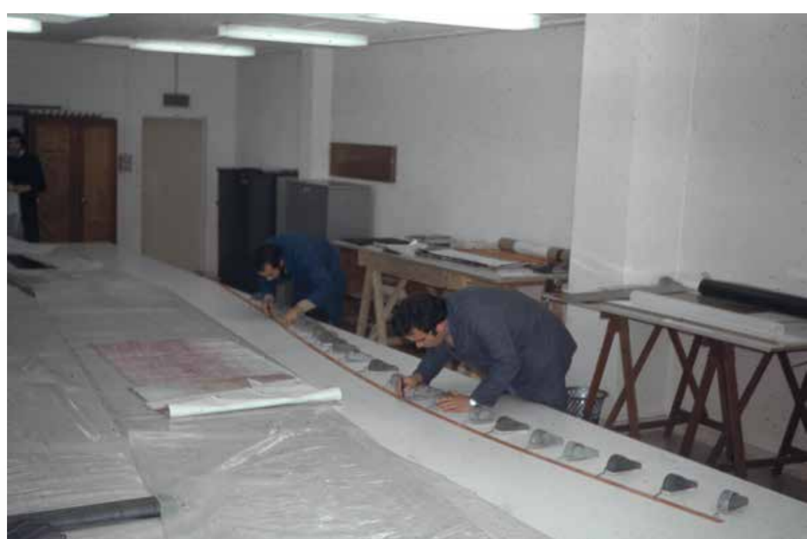
Tracé au dixième avec une fine latte en bois et des poids.