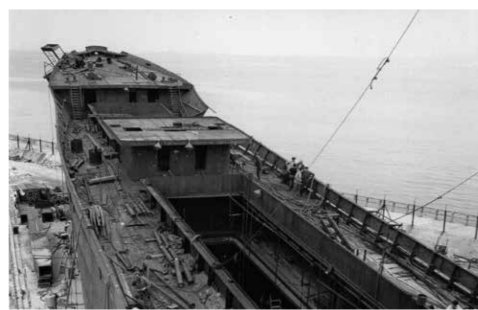
Construction du Marie-Thérèse Le Borgne en 1961.

“ Il fallait s'adapter, on faisait des stages... Et puis nous, en tant que chefs d'équipe et contremaîtres, on était obligé de savoir dire aux gars comment il fallait faire. ”