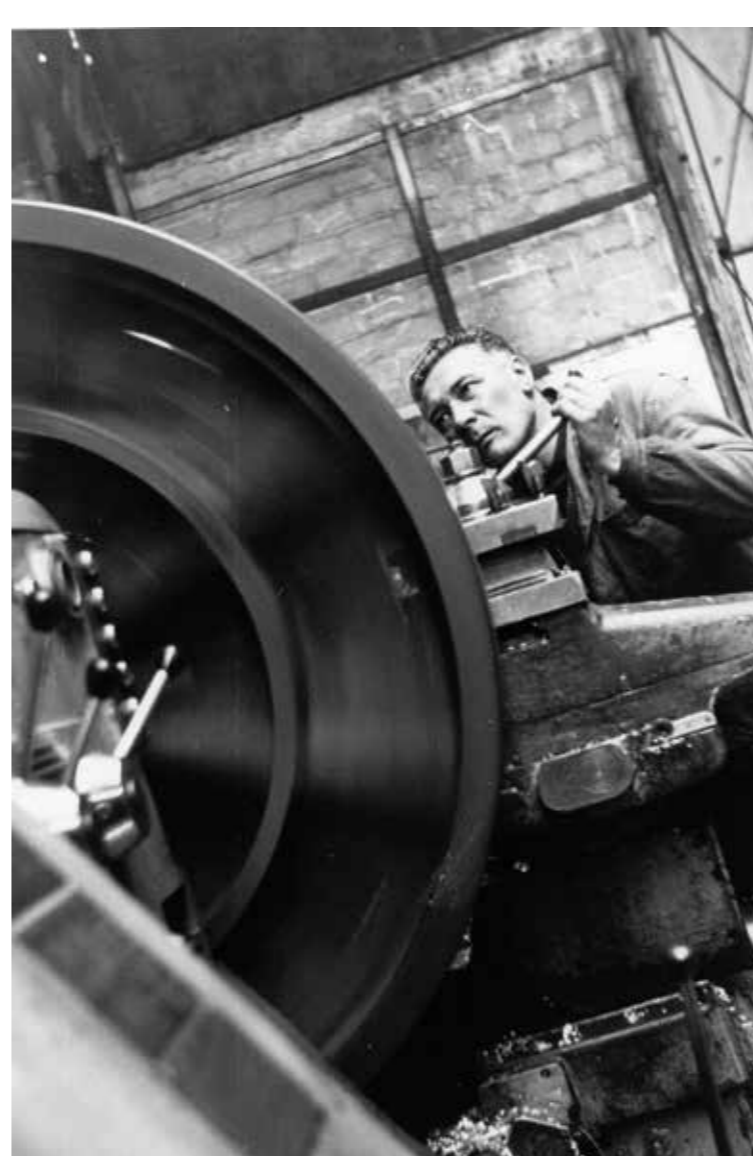
Tournage d'un arbre porte hélice dans l'atelier de mécanique, en 1967.

Quelques bateaux prestigieux ont marqué les ouvriers tel l' Alcyone , le bateau en aluminium du commandant Cousteau, ou un bateau géotechnique de forage. Les Chantiers ne construisent pratiquement pas de séries, hormis 66 crevettiers pour le Koweït à la fin des années 1960 et une trentaine de chalutiers pour la Corée. Du côté du secteur industriel, la diversité est aussi de mise avec des télescopes, des caissons hyperbares, des tourelles de plongée, des corps d'affût de canons, des machines-outils, etc.