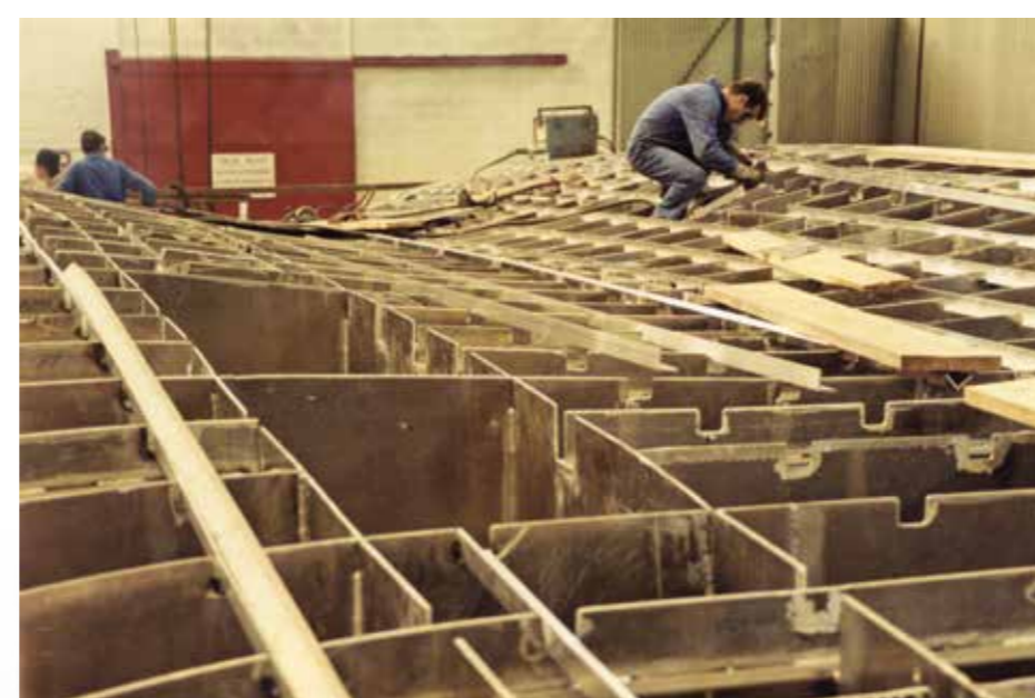
Pose des lisses sur le bordé de fond de l' Alcyone .