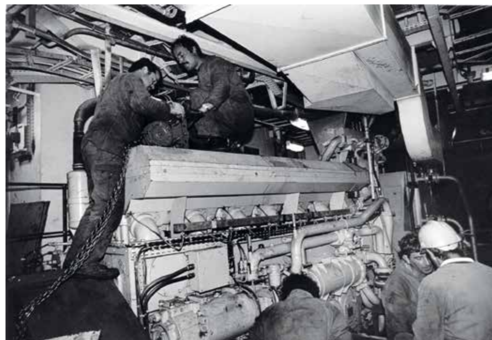
Compartiment moteur d'un bateau.

“ Les gars qui étaient au découpage, ils avaient de gros gants molletonnés en amiante. ”