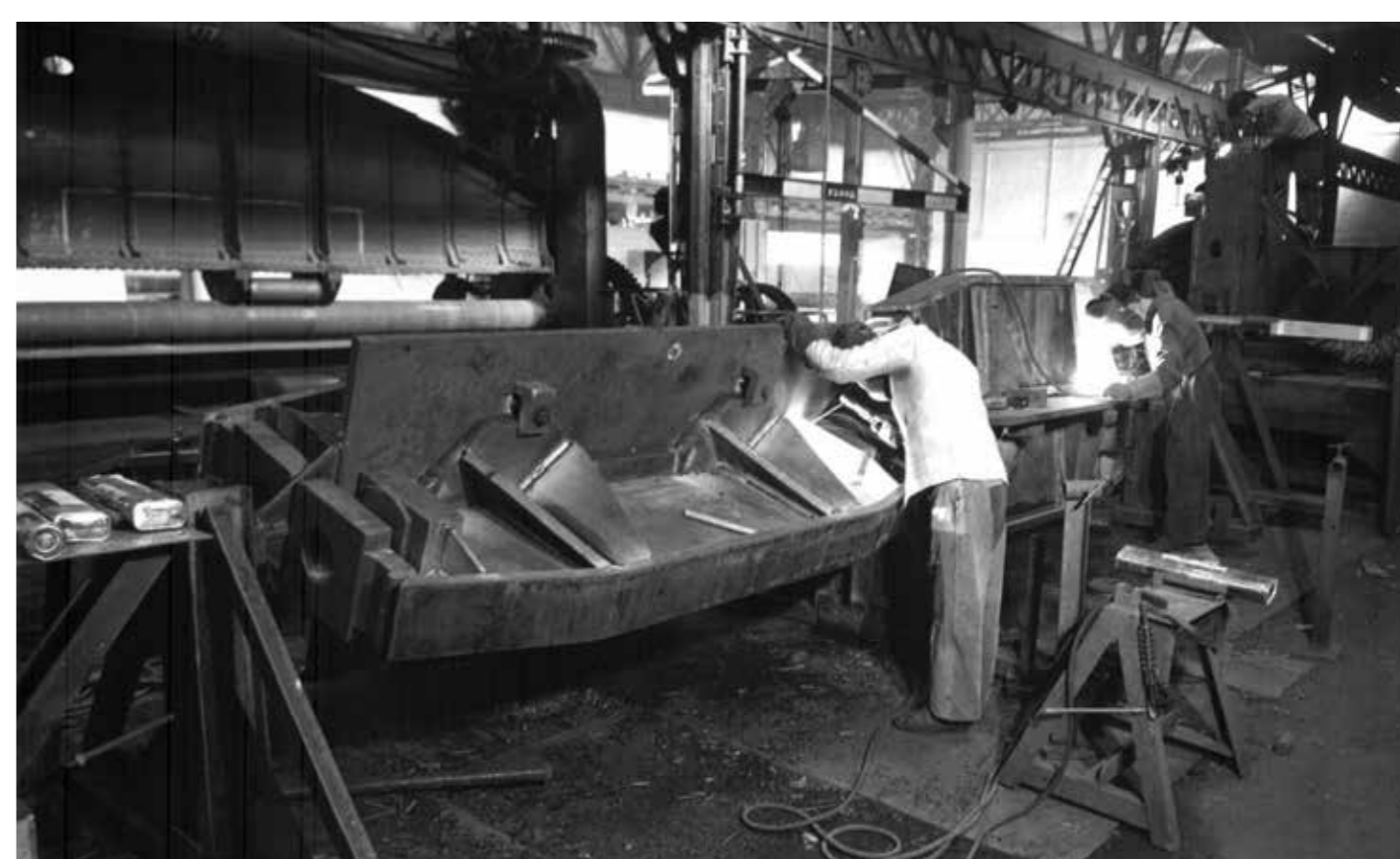
Soudage des traverses supérieures de presses à pneus pour Michelin, en 1970.

L'entreprise est structurée en deux grands secteurs : la partie navale comprenant la réparation, mais aussi la préparation, la construction et l'armement des bateaux, et la partie terrestre, destinée à l'industrie, avec un atelier de chaudronnerie et de mécanique. Tous les corps de métier sont présents et dessinateurs, chaudronniers, traceurs, serruriers, menuisiers, électriciens, ajusteurs, tuyauteurs, mécaniciens se relaient dans les cales et les ateliers.