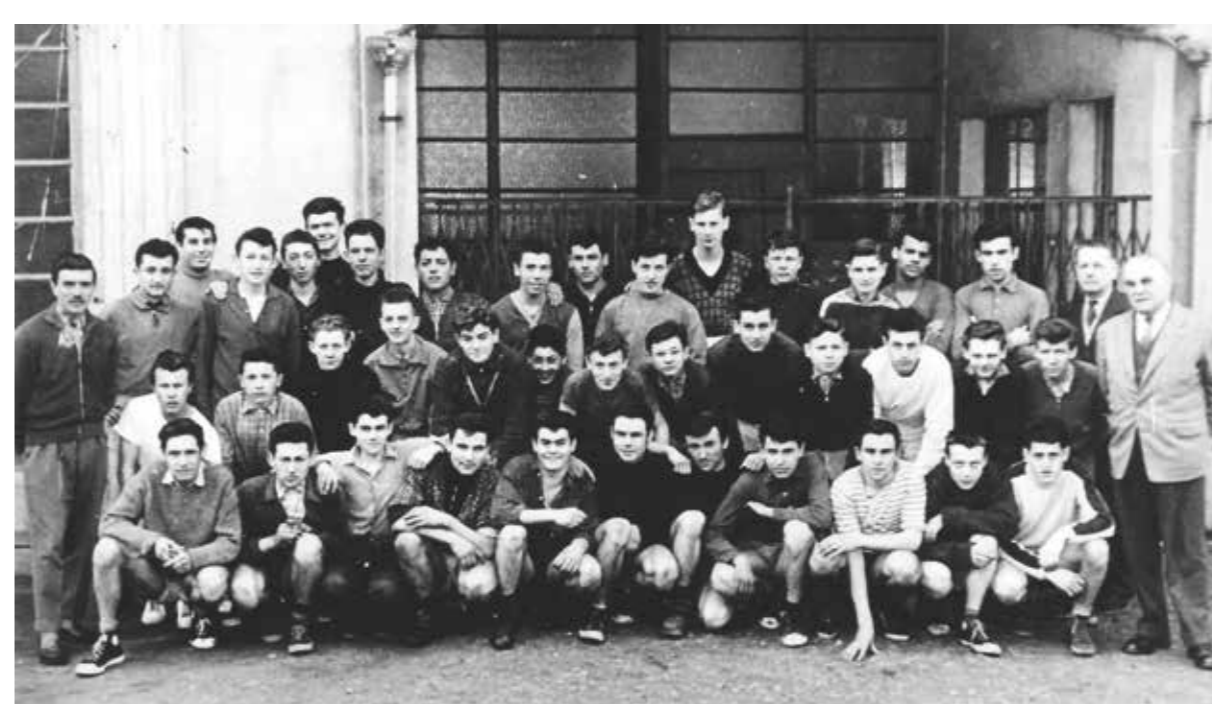
Les élèves avec le directeur et les professeurs de l'école d'apprentissage, en 1958.

Parmi les ouvriers, certains sont formés à l'école d'apprentissage des Chantiers, créée en 1940 rue Denfert-Rochereau à La Pallice et fermée en 1980. Le jeune, admis sur concours, n'est généralement pas dépaysé puisqu'il y retrouve nombre de garçons de son quartier qui, comme lui, sont fils, petits-fils et neveux d'ouvriers des Chantiers. L'école forme, en trois ans, aux métiers de chaudronnier-soudeur, ajusteur et tourneur. Les moniteurs sont d'anciens ouvriers qualifiés de l'entreprise.