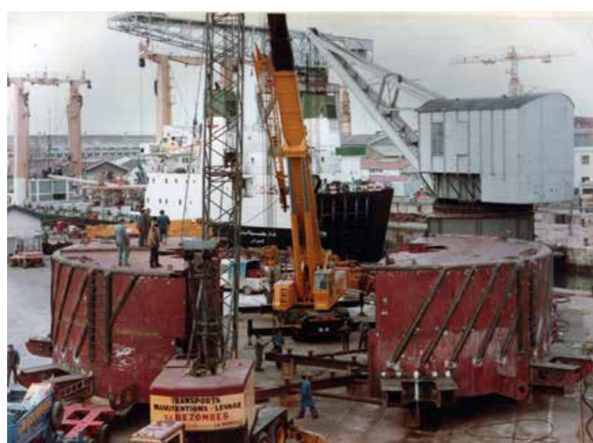
Construction d'une bouée d'amarrage offshore pour l'Éthiopie, en 1981.