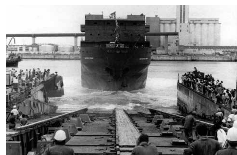
Lancement du bateau indien de géophysique Samudra Sarvekshak, en 1986.

“ Dans un bateau, il y a des kilomètres de tuyaux et de câbles électriques, et tout l'habillage se fait en menuiserie... ”