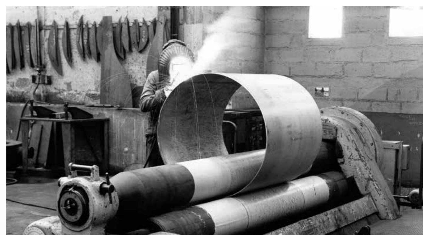
Soudure d'un tronçon de tuyau pour le silo à grains de La Pallice, en 1975.