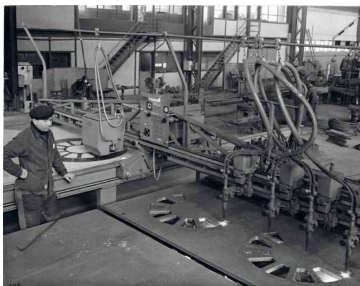
Découpage dans l'atelier de chaudronnerie, en 1980.

“ Quand on arrivait de l'école d'apprentissage en tant que jeune ouvrier chaudronnier, on était toujours second d'un ancien compagnon qui nous faisait voir les combines, parce qu'il y avait plein de combines dans ces métiers-là... Après, quand le jeune avait appris le métier comme il faut, l'ancien montait et l'autre prenait la place auprès d'un gamin sortant de l'école d'apprentissage. ”